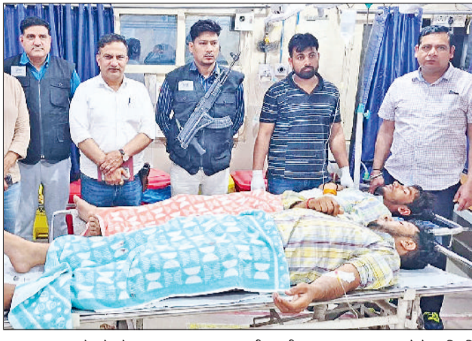
बहादुरगढ़। मुठभेड़ के दौरान घायल बदमाश व एसटीएफ टीम।