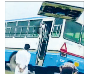
डिवाइडर पर फंसी रोडवेज बस।

नेशनल हाइवे पर रोडवेज की किलोमीटर स्कीम के बस ड्राइवर ने सवारियों की जान जोखिम में डालने का काम किया। ड्राइवर ने जान बूझकर बस को डिवाइडर के ऊपर से निकालने की कोशिश की। मगर बस निकली नहीं और वहां फंस गई। काफी देर तक बस डिवाइडर पर ही फंसी रही। बाद में सवारियों को नीचे उतार कर दूसरी बस में चढ़ाकर गंतव्य की ओर रवाना किया गया।